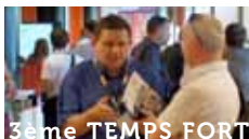
3ème TEMPS FORT

Décideurs IT et Destination E-Commerce en partenariat avec Le Monde Informatique et le magazine CIO. Enregistrées en public à l'occasion des Rendez-Vous du Numérique, ces émissions font le point sur les sujets d'actualité IT et E-Commerce les plus chauds.