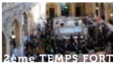
2ème TEMPS FORT

Les meilleurs experts du numérique en Alsace élisent sous vos yeux les meilleures solutions au service de votre e-commerce et de votre productivité.