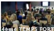
4ème TEMPS FORT

Près de 50 exposants vous présentent leurs solutions les plus innovantes et leurs cas clients les plus rentables.