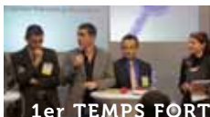
1er TEMPS FORT